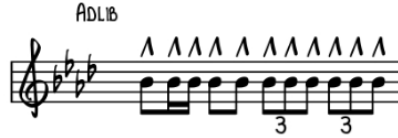
الشكل رقم (١٣) يوضح ماركاتو في م ١