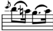
الشكل رقم (١٩) يوضح الإنتقال بين الثاني والثالث في م ١٣٥

إنتقال بين الوضع الثاني و الرابع ظهر في :